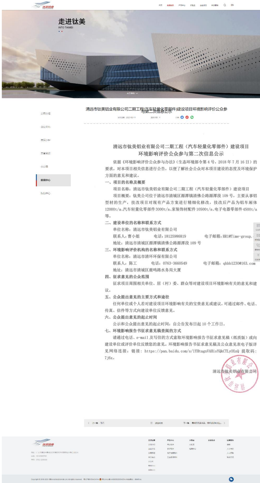
图 3-2 征求意见稿网上公示照片