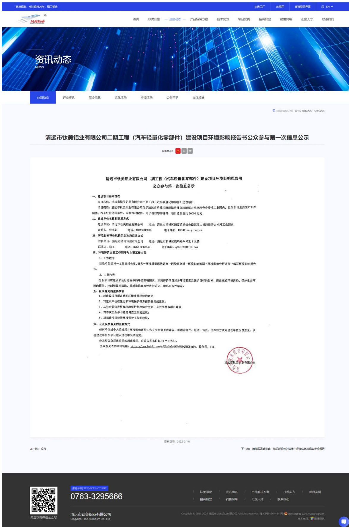
图 2-2 首次网上公示照片