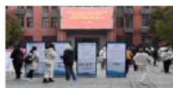
基层就业的鼓励政策,进一步充实基层人才队伍。

D 鼓励人才投身基层建设 “三不限”岗位相应增加 在各地发布的2023年度公务员招录公告中,不少地区推出支持各类人才到