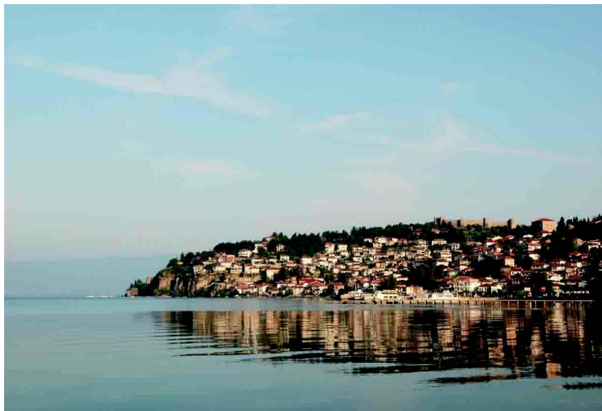
奥赫里德市老城，山顶为塞缪尔城堡遗址

自1993年以来，北马其顿陆续成为世界银行和国际发展协会的成员国，并于2003年加入世界贸易组织。