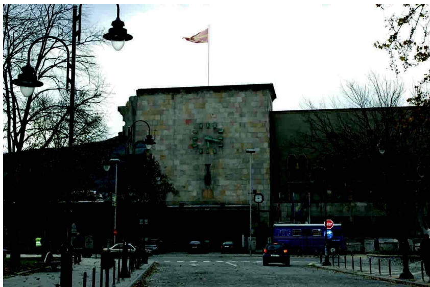
斯科普里市地震博物馆，1963年大地震后遗留的残垣断壁仍清晰可见