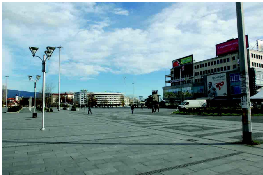
斯科普里市中心“喷泉广场”

首都斯科普里是北马其顿政治、经济、文化和交通中心，位于北马其顿西北部，海拔240米。斯科普里四周高山环绕，瓦尔达尔河贯穿整个城市，夏季炎热，冬季寒冷，全年降水均匀，年均降雨量483mm，平均温度12.4℃。斯科普里现有人口约61万。该市是巴尔干半岛通往爱琴海和亚得里亚海的重要交通枢纽，是全国最大烟草加工中心，还有冶金、机械制造（汽车、农业机械等）、化学、电气器材、水泥、玻璃等工业。这里还以金银饰品等手工艺品闻名。斯科普里大学是北马其顿最大的综合性大学，为北马其顿培养了大批专业技术人才。